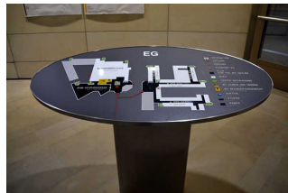
Bedienelemente/ Gehbahn/ Ausleuchtung/ Beschilderung