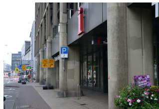
Bedienelemente/ Gehbahn/ Ausleuchtung/ Beschilderung