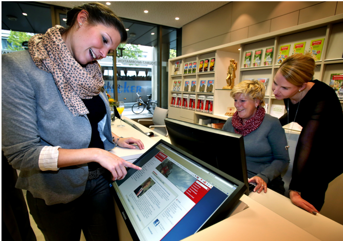
Tourist-Information Bielefeld