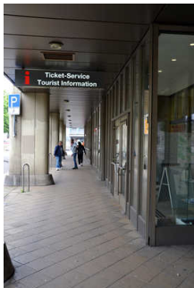
Bedienelemente/ Gehbahn/ Ausleuchtung/ Beschilderung