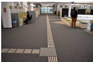
Bedienelemente/ Gehbahn/ Ausleuchtung/ Beschilderung