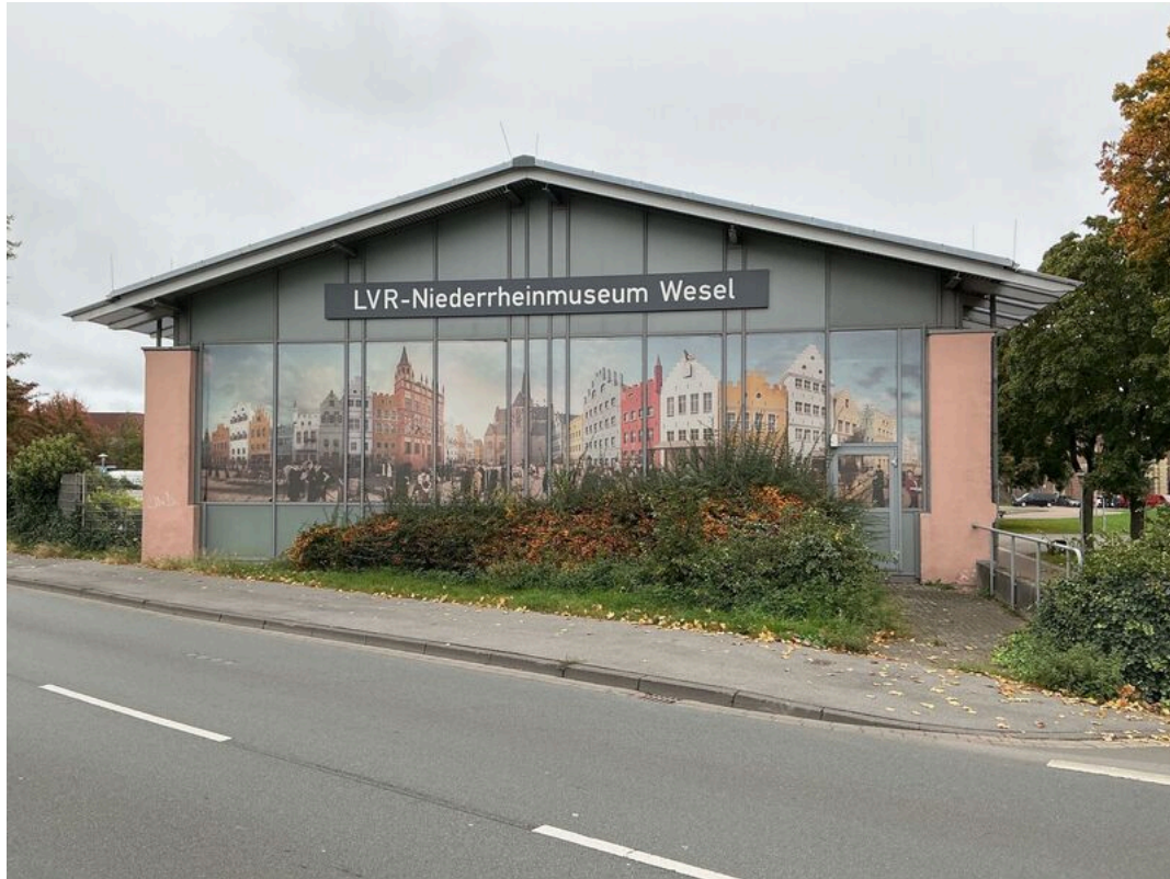
LVR-Niederrheinmuseum Wesel